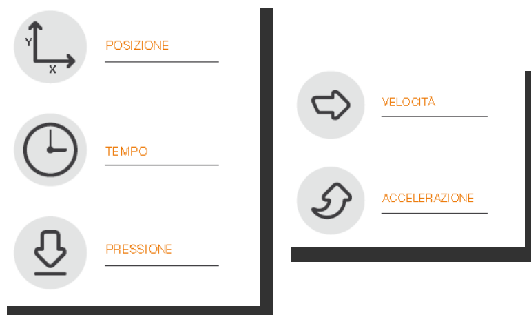
Fig.1 - Schema

Gli elementi disponibili nell'apposizione della sottoscrizione da parte del FIRMATARIO , sono i dati biometrici e comportamentali, quali: Posizione della penna, Pressione, Tratto in aria (percorso che fa la penna quando non tocca nel device, fino a 1cm ), e Tempo. E' possibile elaborare velocità e accelerazione ai fini di analisi forensi.